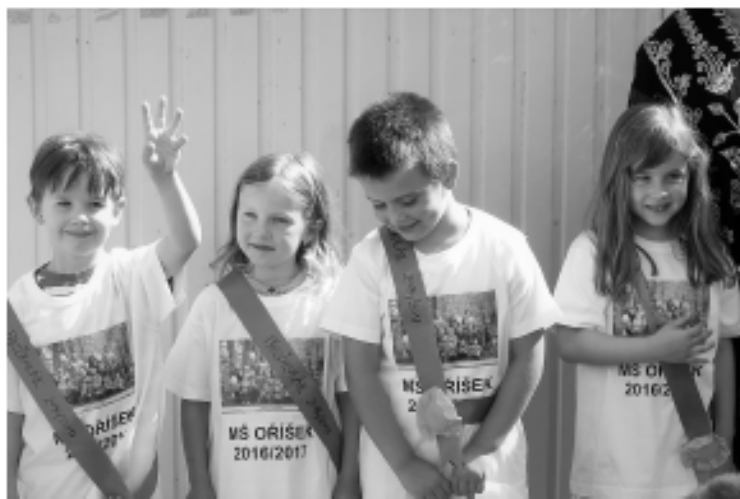
Předškoláci byli na konci školního roku pasováni na školáky.

Před letními prázdninami jsme se rozloučili s našimi čtyřmi předškoláky a zakončili školní rok posezením u táboráku společně i s rodiči.