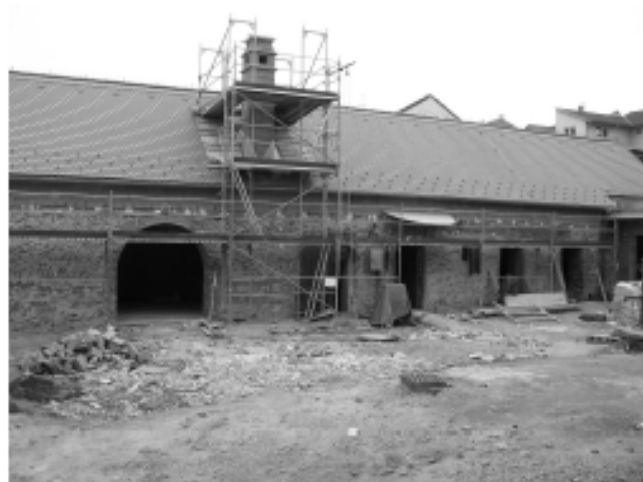
Hájinka při kontrolním dnu v úterý 19. září. Od kolaudace jí dělí jen pár dní.