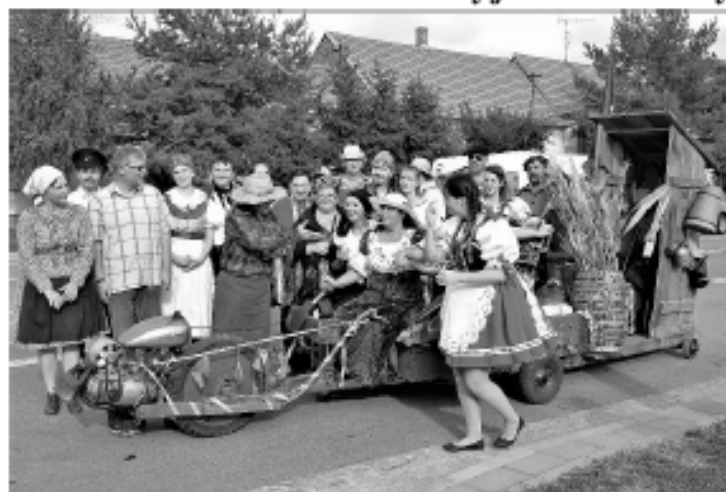
Nosislav uspořádala slavnost Otevřené sklepy.