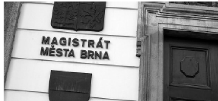
O mnoha důležitých věcech pro městské části se rozhoduje až na magistrátu.

Zastupitelstvo města Brna ovládá příjmy města a využívá toho k ovládnutí městských částí. Ty musí pro každou významnější investici žádat na velké radnici o dotaci.