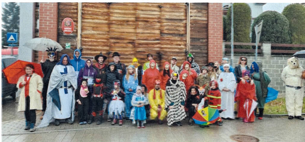
Na ostatky s průvodek masek vás pozvali ořešínští hasiči.

Aktuální novinky z TJ Sokol Ořešín můžete sledovat na: